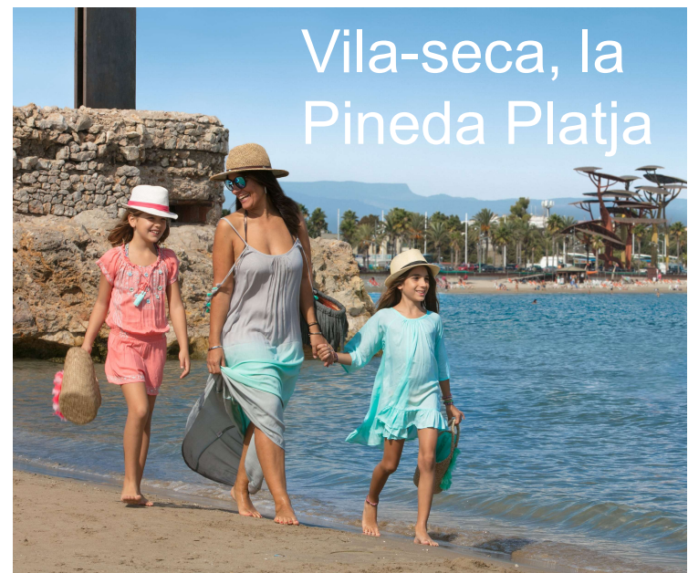
Vila-seca, la Pineda Platja