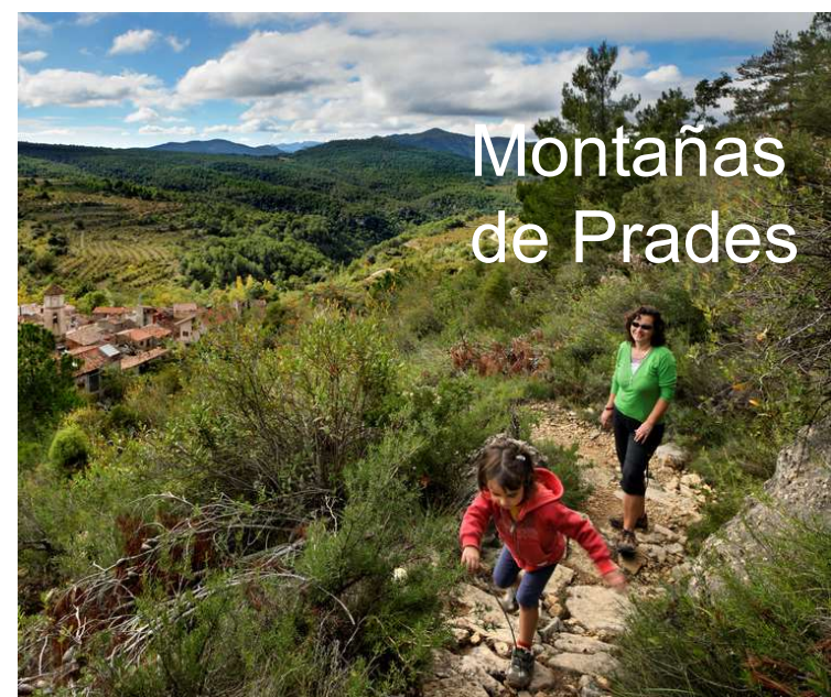
Montañas de Prades